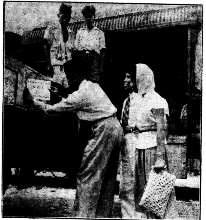
Sumbangan NIT kepada Republik blik yang berupa tekstil, sepatu, benang, obat2an d.l.l. ketika diangkut kekereta api untuk dibawa ke Jogja. Disini kelihatan An di Patapoi (sedang menempel plakat) dan njonja Warok, sebagai wakil NIT untuk menjampai barang2 tersebut kepada pemerintah pusat Republik (Photo: Ipphos).